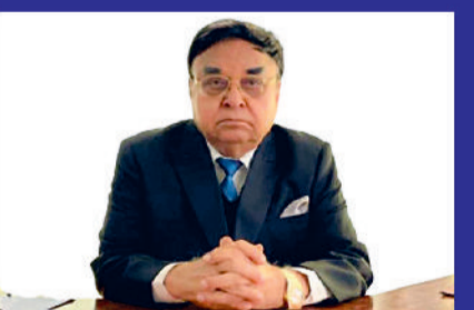
MICRON PRECISION SCREWS A Renowned Industrial Fasteners Manufacturer with a Proven Track Record of 40 Years

माइक्रॉन ग्रुप ऑफ इंडस्ट्रीज ने सभी प्लांट्स में नवीनतम परीक्षण उपकरणों के साथ लैबोरेटरी स्थापित कर ली है। माइक्रॉन प्रेसिजन स्क्रूज प्लांट 1 को 1979 में एक प्राइवेट लिमिटेड कंपनी के रूप में समर्थित किया गया था। इसे हरियाणा, चंडीगढ़ के उद्योग निदेशालय के साथ एक इंजीनियरिंग इकाई के रूप में पंजीकृत किया गया है, औद्योगिक और ऑटोमोटिव फास्टरस निमाता और आपूर्तिकर्ता के रूप में उच्च ताकतल इंडस्ट्रियल और ऑटोमोटिव इंडस्ट्रियल फास्टरस के लिए। इसके प्रारंभिक दिनों में, यह मुख्यतः गाड़ी क्षेत्र के लिए ग्राहक निदेशों के अनुसार फोर्जिंग कंपोनेंट्स निर्मित कर रहा था। 2017 में, एमपीएस प्लांट को स्थापित किया गया और यह एक क्लोसली हेल्ड लिमिटेड कंपनी बन गया। इस नए प्लांट में, अपराजेय स्वदेशी और आयातित निर्माण क्षमताओं को हॉट और कोल्ड फोर्जिंग तकनीकों में स्थापित किया गया था। कस्टम सिंथेसिस और विश्लेषण सेवा कंपनियों के लगातार बढ़ते क्षेत्र में, हमें यह मान्यता है कि हमें हमारे ग्राहकों को अद्वितीय और व्यक्तिगत सेवाएं प्रदान करनी चाहिए।